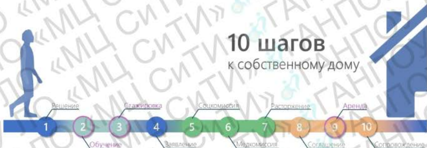
Рисунок 1 – Схема реализации сопровождаемого проживания в Ленинградской области

На рисунке 1 представлена схема реализации технологии сопровождаемого проживания в Ленинградской области.